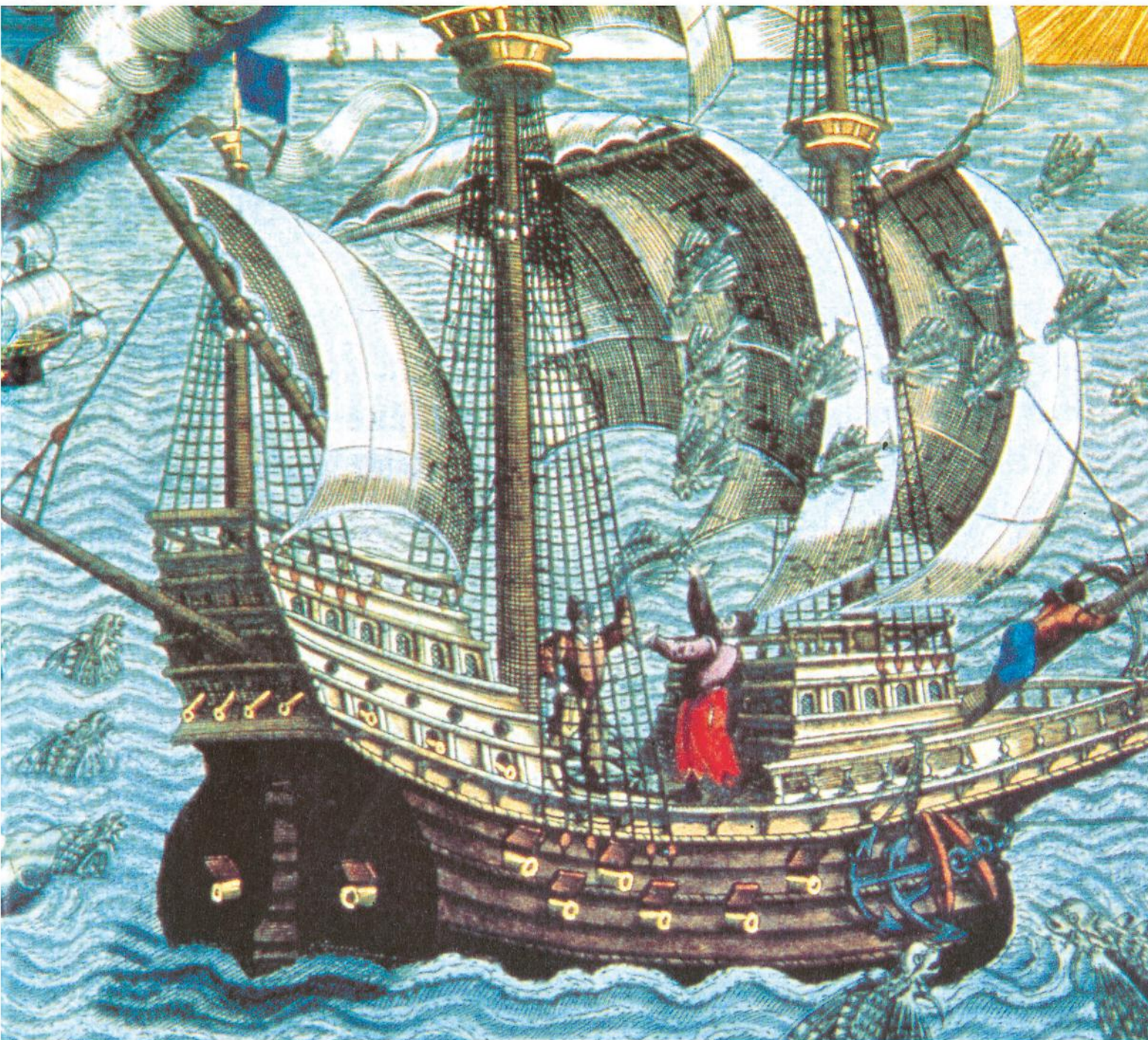
Gravura de Theodore de Bry, feita em 1592, mostrando navios portugueses no litoral brasileiro.

Muitas coisas a respeito dessa grande aventura que foi a travessia do oceano Atlântico e o conhecimento de novas terras e seus habitantes não serão assunto desta obra. Mas esperamos que ela desperte a sua curiosidade, incentivando-o a conhecer mais sobre o assunto, e chame sua atenção para a necessidade de respeitar as diferenças existentes ainda hoje entre os povos.