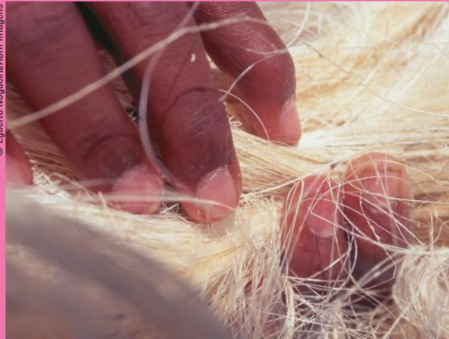
Trabalho infantil na sisaleira Retiro, em Retirolândia, interior da Bahia, agosto de 1995.