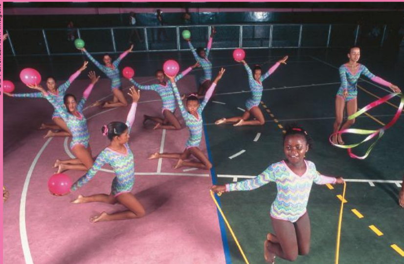
Aula de ginástica olímpica na Vila Olímpica – projeto patrocinado pela Xerox do Brasil para as crianças da favela da Mangueira, no Rio de Janeiro, em abril de 1998.